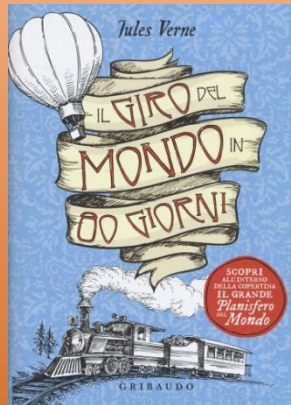
Il giro del mondo in ottanta giorni

Dice di non viaggiare tranne che in sogno