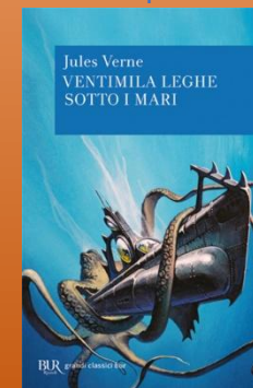
Ventimila leghe sotto i mari

Quasi tutti i suoi testi narrano di viaggi